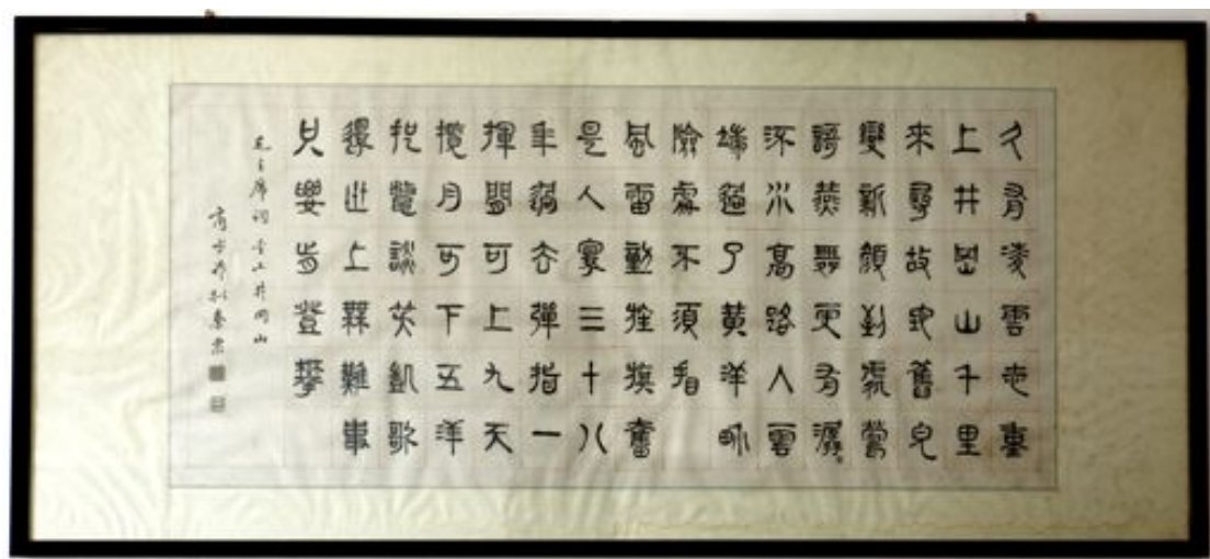
這是商老於70年代書贈廣州聾校的小篆橫幅

唐代詩人李商隱（約813 - 約858），字義山。《夜雨寄北》全文：“君問歸期未有期，巴山夜雨漲秋池。何當共剪西窗燭，卻話巴山夜雨時。”末二句的“何當”、“卻話”意為“何時”和“還訴說”。這首七言絕句原來是為誰作，向來有兩說，一直懸而未決。一說是他從異鄉巴蜀寫給在長安的妻子的。另一說是寄給好友的。商老既然引此詩見贈，顯然他認為原為友人而作，也是可能的。